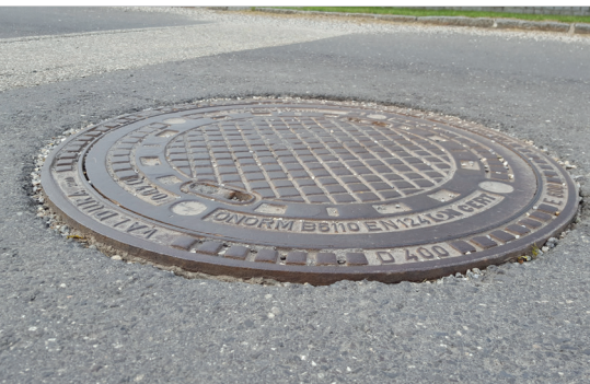
Schachtabdeckung über Asphaltniveau