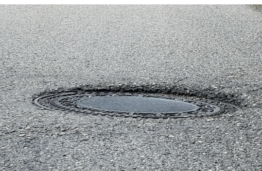
Schachtabdeckung unter Asphaltniveau